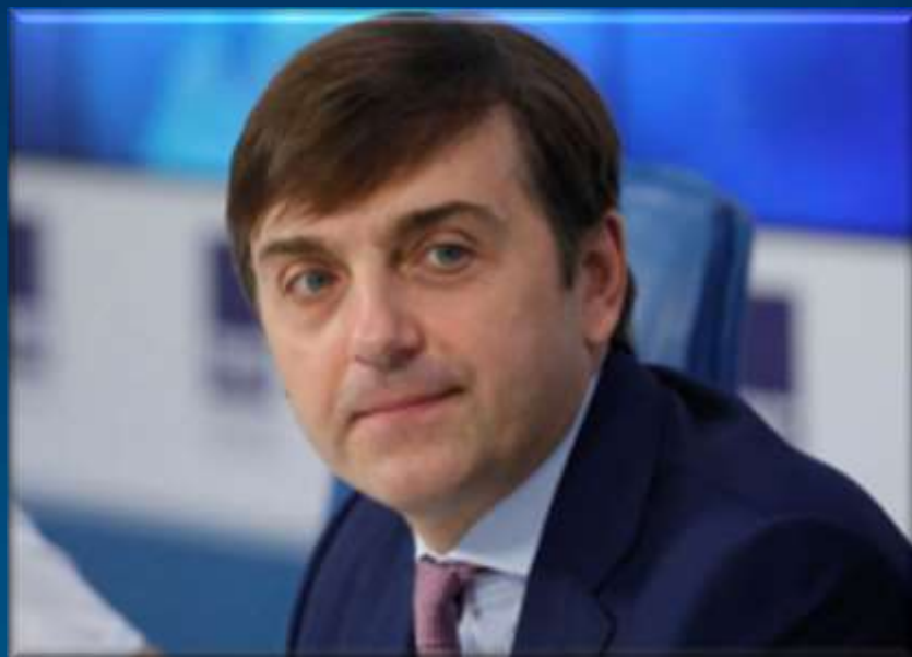
Кравцов С.С. Министр Просвещения РФ

Уверен, что совместными усилиями нам удастся много добиться в этом ответственном деле, обеспечить всем дошкольникам в нашей стране счастливое и беззаботное детство.