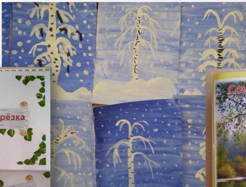
Вернисаж детских работ